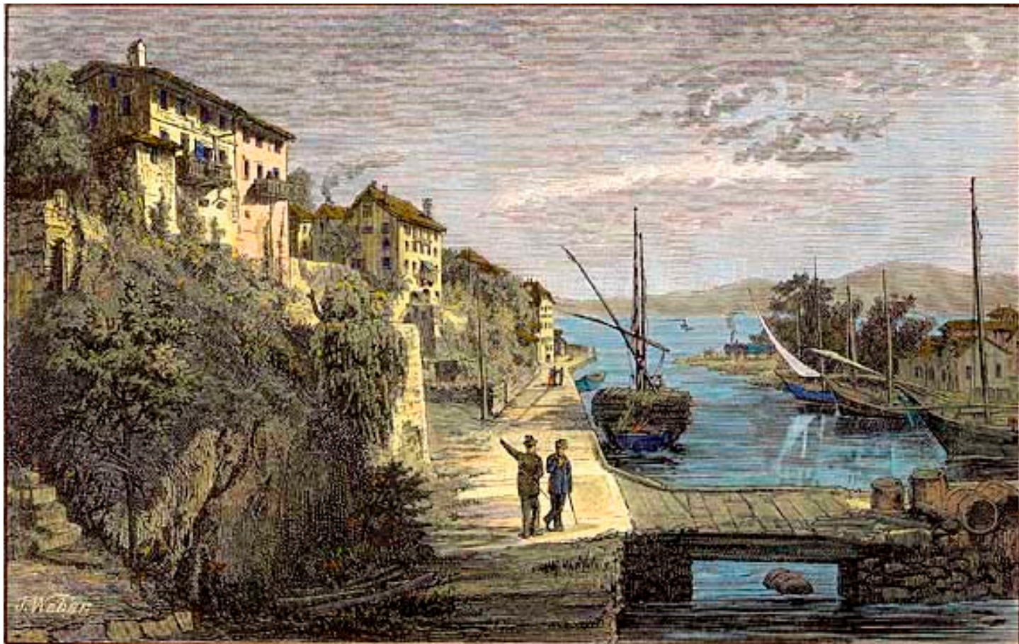
PORT-SAÏD - LE BOUVERET